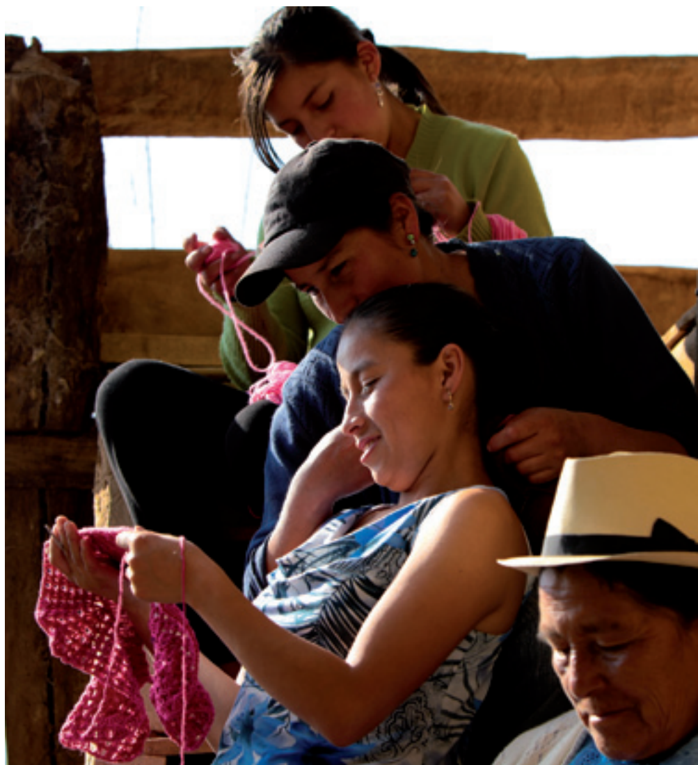
Socias tejedoras de la comunidad de Pagran. Rafael Portal

A. R.: El lenguaje no sólo lo cambia el medio de comunicación, sino que responde a una reclamación o a una reivindicación de la calle, de los colectivos de base.