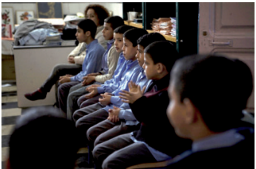
Niños de la Madraza. Isabel M. Calero

Integración e interculturalidad no son lo mismo. Son dos términos cuya fusión es más interesante o su conversión en compañeros de lucha. Los migrantes no sentimos ciudadanos hasta que no compartimos la lucha. Realmente ciudadanos no somos de pleno derecho, no votamos, pero compañeros de lucha sí podemos ser, y ahí es donde nos integramos