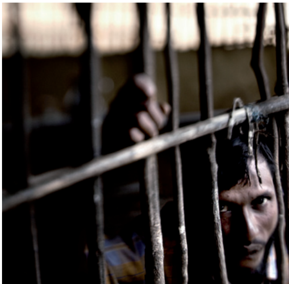
Refugiados. Javier Arcenillas

Todo lo anteriormente expuesto hará que exista una desigualdad apriorística entre stranieri y los supuestos autóctonos, reflejada más concretamente, en la interpretación del art. 13 de la Carta Magna española. 1