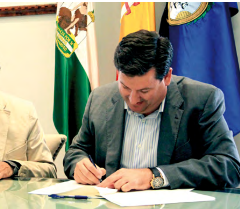
Firma del convenio de colaboración entre el FAMSI y CEPES-A