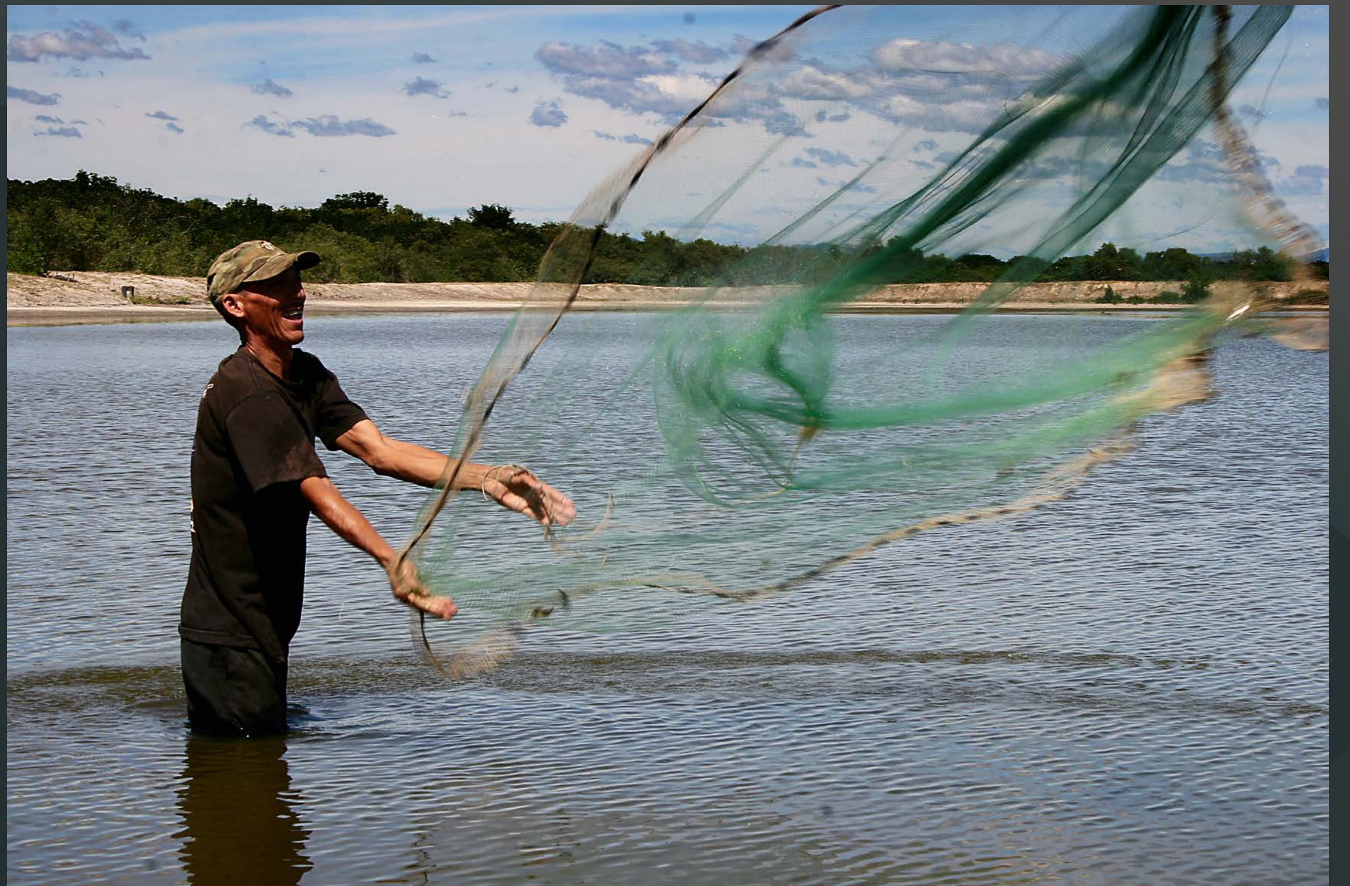
FOTOS 2, 3 En el departamento de San Hilario, El Salvador, desarrollan la actividad de pesca con redes y a uno de los dirigentes durante una asamblea, pudiendo comprobar las secuelas de la guerra. Autor: ANTONIO GALISTEO LÓPEZ Reportaje: Ex guerrilleros salvadoreños del FMLN. Salinas del Potrero, El Salvador. Mención especial I Certamen Andalucía Solidaria. En las imágenes vemos una escena camaronera en las 'Salinas del Potrero' un nutrido grupo de excombatientes del FMLN (Frente Farabundo Martí de Liberación Nacional), en su mayoría integrados por desmovilizados del ejército del gobierno y mutilados de guerra, un grupo de familias que han vivido en total abandono hasta la intervención de la cooperación internacional.