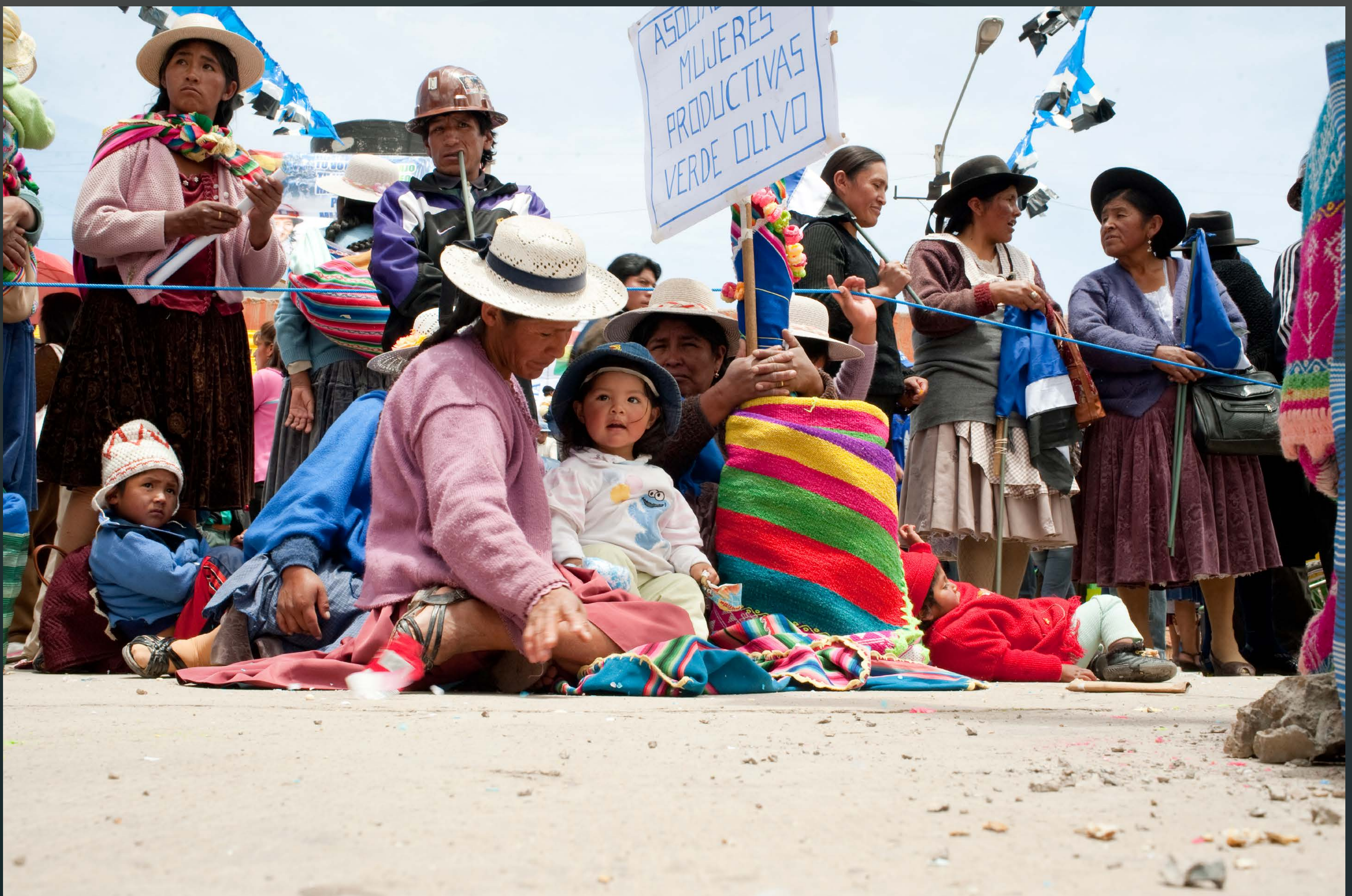
Autor: ANTONIO PÉREZ GIL En huelga (Bolivia 2010).

¿SABES QUE EN MUCHOS LUGARES DEL MUNDO TENER TRABAJO NO PERMITE SALIR DE LA POBREZA?