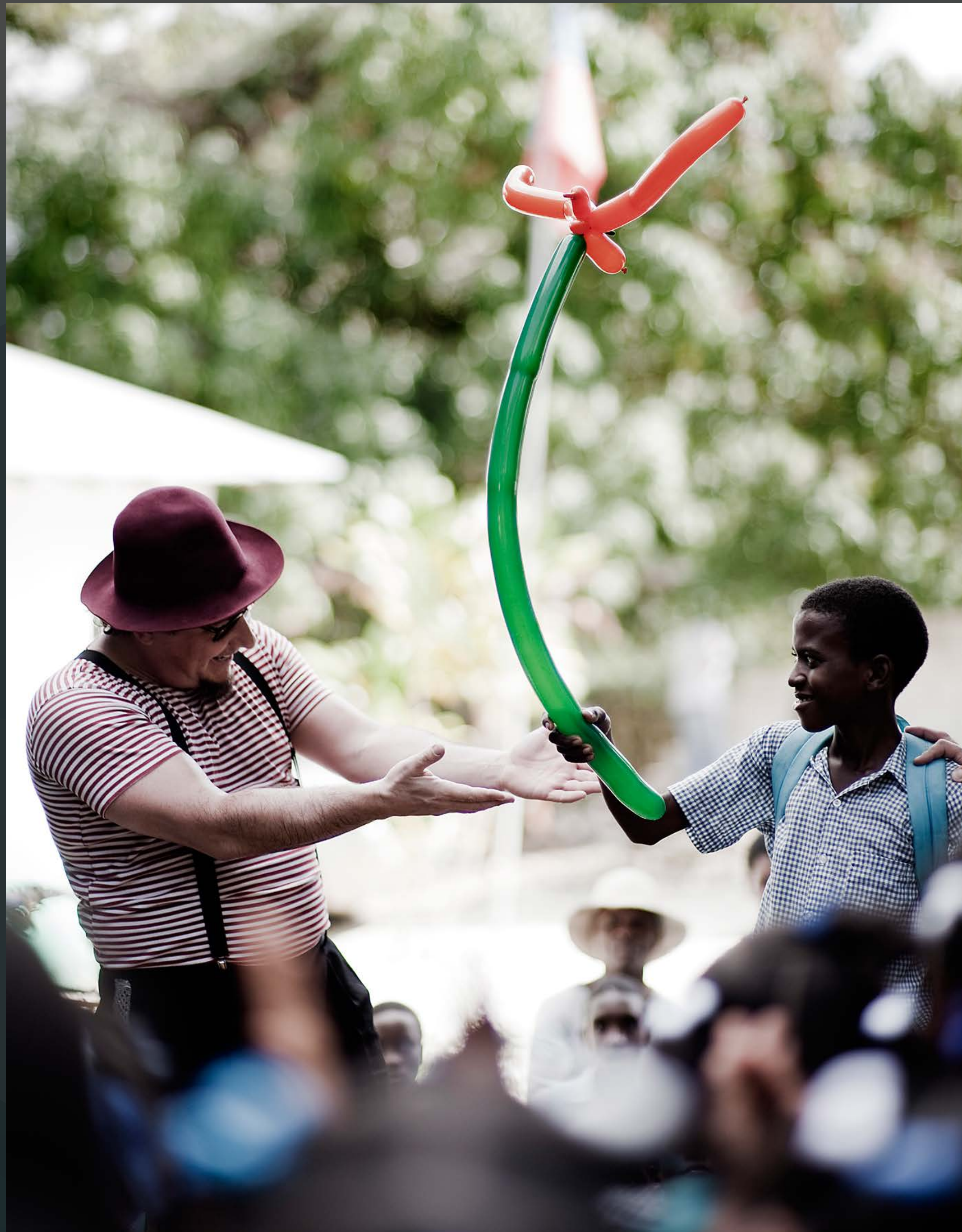
FOTOS 1 y 2: Autor: ANTONIO GALISTEO LÓPEZ Arrancando Sonrisas. Haití 2011.

¿SABES QUE TODOS Y TODAS ESTAMOS LLAMADOS A PARTICIPAR EN ESTA AGENDA DE DESARROLLO SOSTENIBLE? ¿QUIERES SER PARTE DE ESTA ALIANZA MUNDIAL?